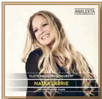
Flûte passion : Schubert 2018