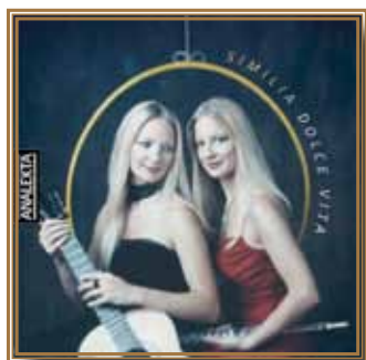
Dolce Vita 2007